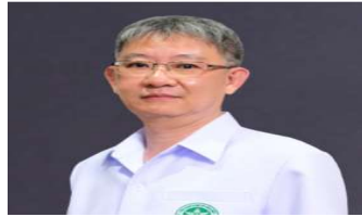
นพ. โอภาส การย์กวินพงศ์ ปลัดกระทรวงสาธารณสุข