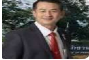
นายแพทย์ชลอนาน ศรีแก้ว รัฐมนตรีว่าการกระทรวงสาธารณสุข

สำนักงานสาธารณสุขอำเภอเมืองลำปาง จังหวัดลำปาง (หน่วยงานภายใต้กระทรวงสาธารณสุข)