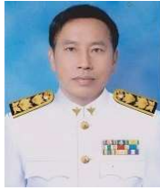
สาธารณสุขอำเภอเมืองลำปาง