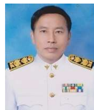
นายชูชาติ กาวีละ สาธารณสุขอำเภอเมืองลำปาง